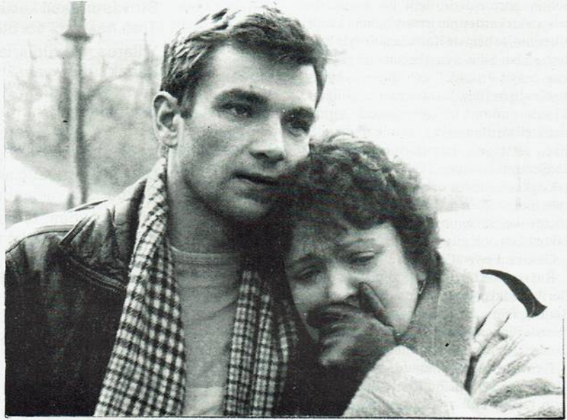
D. Almanya'da eşcinsellik konusunu ele alan ilk film. ÇIKIŞ

Felaket Kız ; Bavyera kasabasında yaşayan genç bir öğrenci kızın, Hitler döneminde kasabada olup bitenler üzerine bir