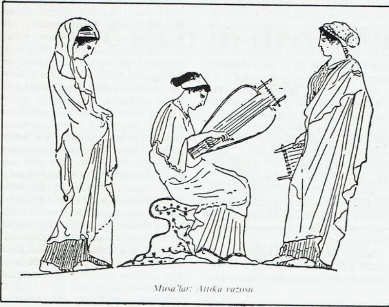
Musa'lar: Attika vazosu

ğin ne denli sağlam olduğunu gösterir." Zaten Mitologlar Anadolu'yu Amazonlar ülkesi olarak tanımlarlar.